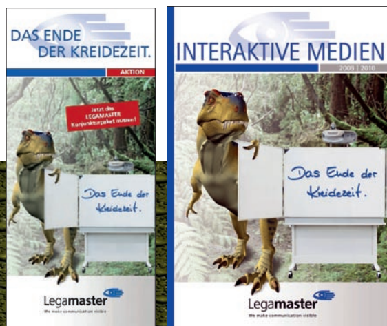
Mit attraktiven Werbebeilagen und Foldern unterstützt Legamaster den Handel.